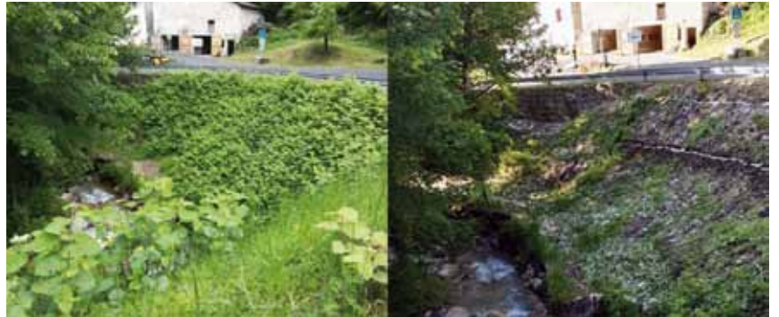
à gauche : prolifération de la Renouée du Japon sur les berges de l'Arvière à Lochieu début mai 2018 / à droite : après la première opération de lutte contre la Renouée du Japon fin mai 2018 (8 opérations sont prévues sur 2018-2019)

La Renouée du Japon est une plante originaire d'Asie importée en Europe au début du 19ème siècle pour ses qualités esthétiques. Elle pousse d'avril à septembre, peut atteindre jusqu'à 3 mètres de haut et s'enracinent jusqu'à 2 mètres de profondeur, stockant ses réserves dans d'imposants rhizomes.