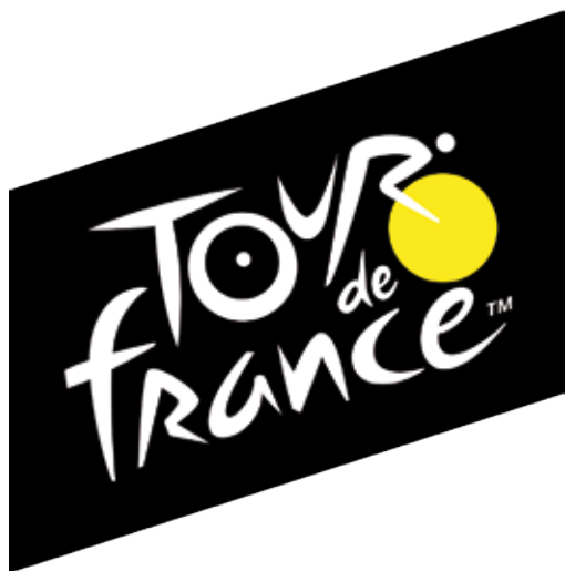
Figure emblématique de notre territoire avec ses quatre voies d'accès, le Grand Colombier fait partie de ces montagnes profondément ancrées dans leur culture locale. Le Tour de France l'a incontestablement doté d'une renommée sportive et médiatique internationale. A la fois craint et admiré, il ne laisse personne indifférent.

Si le col du Grand Colombier n'est pas le plus connu en France, il est l'un des plus difficile si l'on en croit les cyclistes.