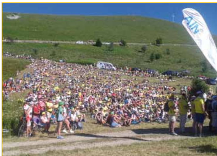
Passage du Tour de France au Colombier en 2017